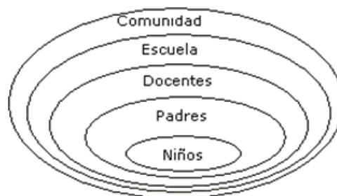
Figura 2. Actores de los Proyectos.

Estos programas tienen como objetivo central a los niños y adolescentes, por ser el principal recurso del país, incorpora a los padres y representantes, por su papel fundamental en la formación y socialización de los hijos y por su condición de principales responsables de la protección de los niños y adolescentes establecidos en la Ley Orgánica de Protección del Niño y Adolescente (7). Igualmente la escuela, con su personal directivo y docente, por sus potencialidades para actuar como elementos líder en funciones de articulación, participación y comunicación con la comunidad (Figura 2).