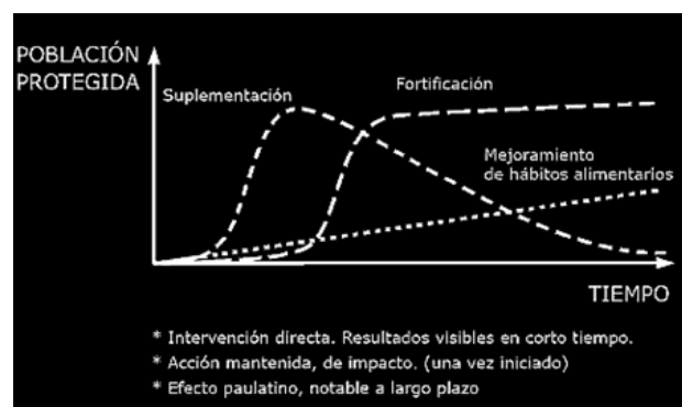
Figura 1. Tres estrategias complementarias

En la Figura 1 se puede apreciar las tres estrategias: Suplementación, Fortificación y Mejoramiento de hábitos alimentarios. La primera de ellas es una intervención directa con resultados visibles en corto tiempo, tal como se evidencia en la relación Población protegida vs. Tiempo y que declina una vez alcanzados los resultados esperados. En el caso de la Fortificación, se observa un período de inducción en el Tiempo mientras se obtiene el consenso requerido para la implementación de esta medida, por ejemplo en el enriquecimiento de la harina de maíz precocida, HMP, en Venezuela cuyos estudios se iniciaron en 1990-1991 por el Instituto Nacional de Nutrición. Esta etapa tomó varios meses de sesiones entre el sector oficial y la industria del sector, culminando con un consenso en lo concerniente al perfil de enriquecimiento. Una vez obtenido este consenso e iniciada la fortificación, se aprecia el impacto esperado al ser adecuadamente implementada y se mantiene en el tiempo. Tal es el caso como se dijo antes, de la HMP, programa que continúa con éxito hasta el presente. El Mejoramiento de los hábitos alimentarios, es una estrategia de efecto paulatino, notable a largo plazo y la cual requiere de un ingrediente educativo sensatamente ejecutado. Estas modalidades no son excluyentes y pueden ser implementadas simultáneamente.