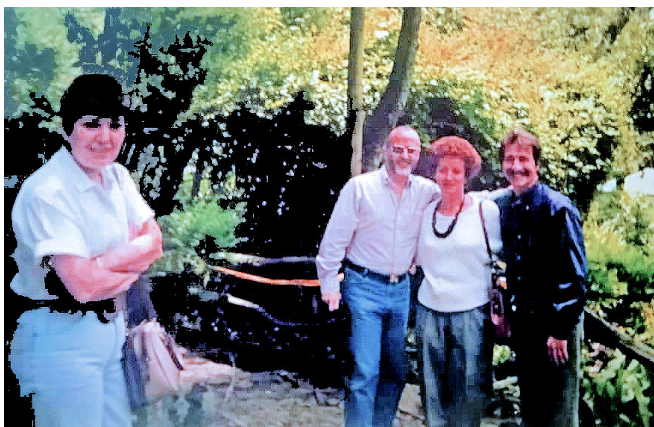
Con el Decano de Medicina y los Directores de las Escuelas Vargas y Bioanálisis

Me correspondió trabajar con un grupo valioso de profesionales de diversas disciplinas y como producto del trabajo en equipo hubo muchos resultados, de los cuales solo mencionaré algunos a título de ejemplo. En la División de Educación, la elaboración de módulos para facilitar las actividades de nutrición comunitaria; en