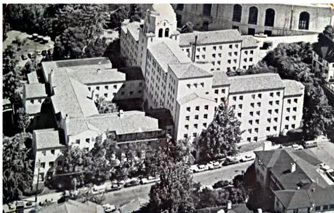
The International House, Berkeley, California.