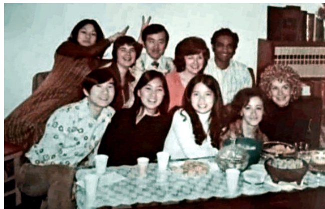
Compañeros de la maestría.

porque sabía que era muy difícil volver a ver a quienes habían sido mis compañeros hasta ese momento.