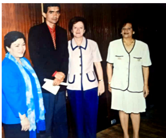
Entrega del Premio Nacional de Nutrición. INN.