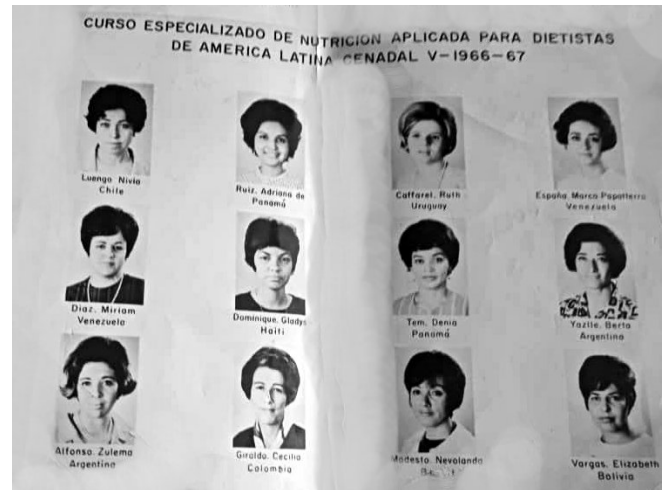
Integrantes del CENADAL.