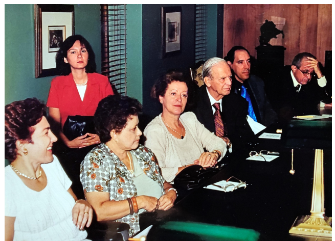
Reunión Técnica en la Fundación CAVENDES.