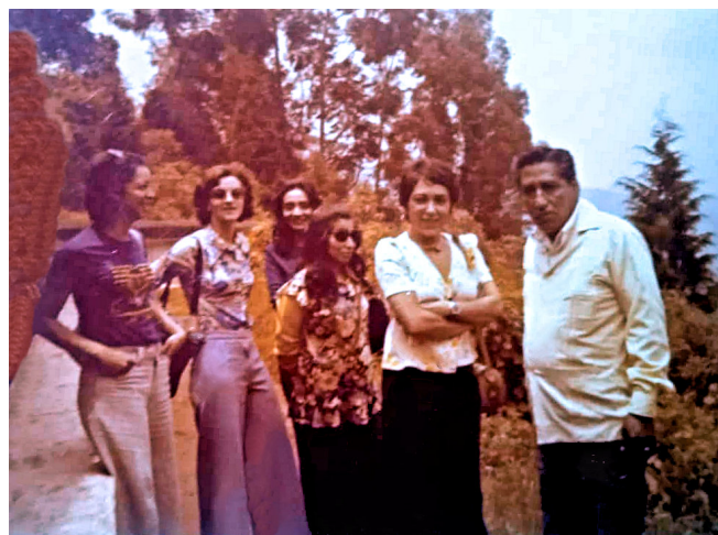
Trabajo de campo en Mexico.