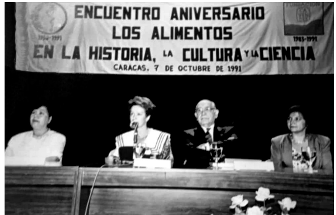
Encuentro Aniversario. Organizado por la Escuela de Nutrición y la Fundación CAVENDES. 1991.

Como todo lo que empieza termina, en junio de 1996 culminé mi gestión, con la solicitud de mi jubilación, rememorando todos los momentos agradables, las